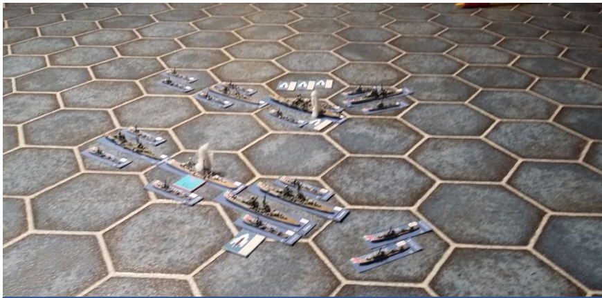
Une torpille perdue du Mohawk ou du Nubian touche le Veneto...

croiseurs et contre torpilleurs italiens qui ne causent pas de dommages décisifs. Les pertes de la RAF et de la FAA sont sensibles. A partir de 10h, la Luftwaffe se met de la partie et la Med. Fleet est attaquée par les Ju 88 et les He 111 : le HMS Barham encaisse une bombe de 250kg et le HMS Formidable deux, mais les blindages limitent les dommages. Les pertes allemandes sont lourdes face aux Fulmar et à la DCA, les 4/LG1 et 5/KG26 devant même être retirés des opérations avec 50% de pertes.